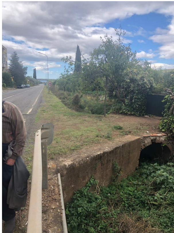
Vista dell'attuale ponte in corrispondenza dell'orto