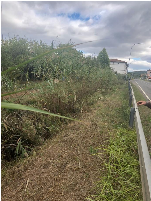
Vista del tratto a valle del tombamento e dell'attraversamento sulla strada provinciale