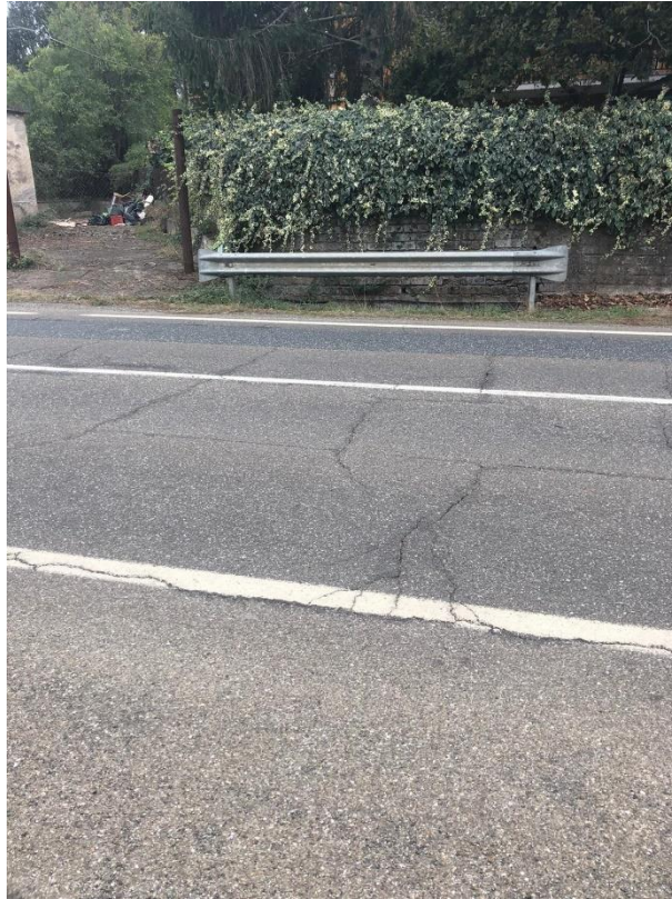
Zona dell'attraversamento sulla strada provinciale