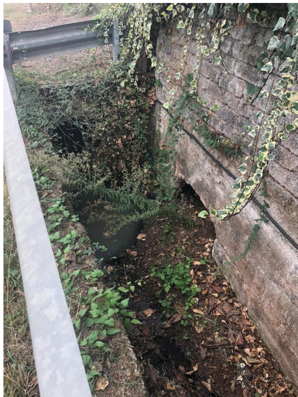
Attuale uscita del tombamento sulla fossa della strada provinciale