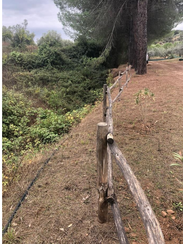
Vista del fosso a monte del tombamento